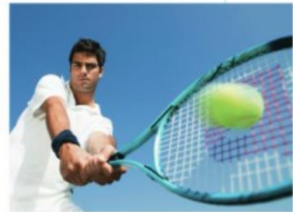
B La balle de tennis qui est frappée.