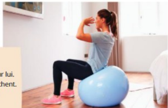
C Le swiss-ball posé sur le sol.