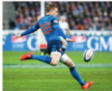
A Le ballon de rugby qui tombe.