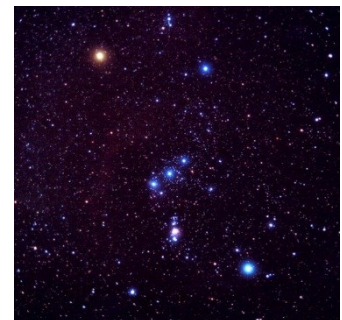
La constellation d'Orion photographié par M. Spinelli. http://www.astrosurf.com/luxorion/orion.htm